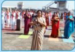
INTERNATIONAL YOGA DAY