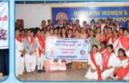
स्वास्थ्य जागरूकता कार्यक्रम