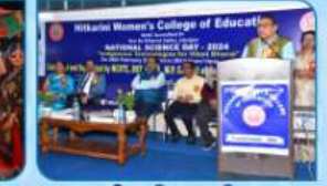
राष्ट्रीय विज्ञान दिवस