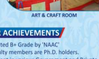
ART & CRAFT ROOM