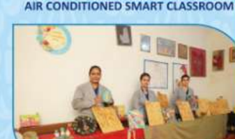
AIR CONDITIONED SMART CLASSROOM